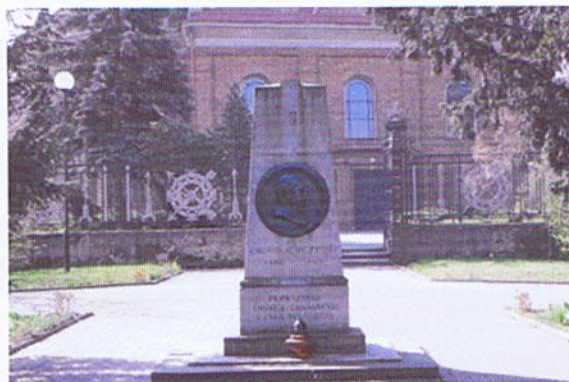
Pomnik ks. O. Kopczyńskiego

Onufry Kopczyński , właściwie Andrzej Kopczyński (urodzony 30 listopada 1735 w Czarniejewie – ksiądz pijar pedagog, prekursor badań nad polską gramatyką, autor pierwszej gramatyki języka polskiego. Napisał łacińsko-polską "Gramatykę dla szkół narodowych", uprościł i uporządkował polską pisownię. Poprzez swoje podręczniki przyczynił się do zachowania tożsamości narodowej Polaków, pozbawionych po rozbiorach własnego państwa. Był ostatnim poetą polsko-łacińskim. Zmarł w 1817 roku w Warszawie.