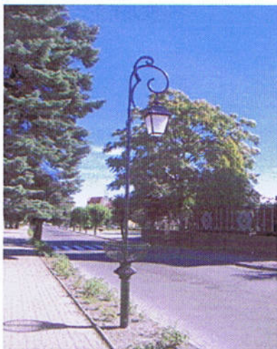
Nowe lampy na ul. Pałacowej w Czerniejewie