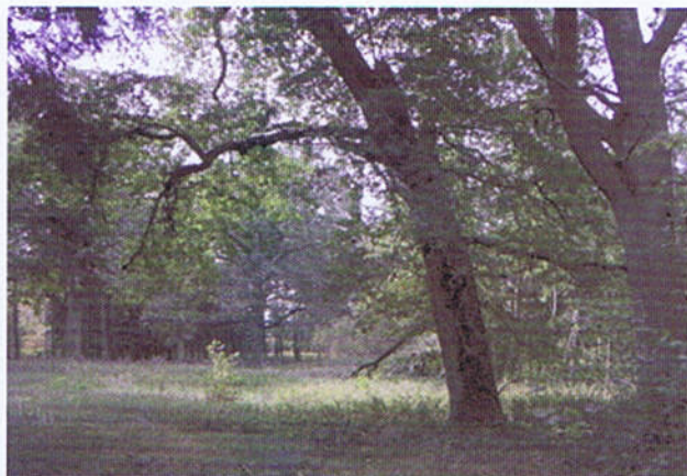
2. Rezerwat „Bielawy”