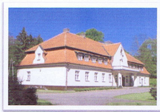
Bażantarnia Zespołu Pałacowego w Czerniejewie