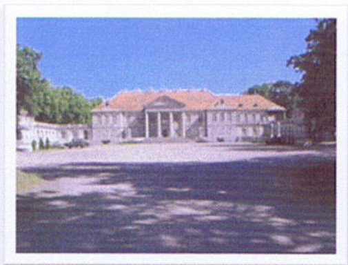
Pałac w Czerniejewie

Do najciekawszych zabytków klasycystycznych należy Czerniejewski Zespół Pałacowy, wybudowany około 1780 roku na miejscu dawnego zamku zniszczonego przez Szwedów. Pałac jest okazałym, piętrowym budynkiem, ozdobionym pośrodku potężnym portykiem wspartym na czterech jońskich kolumnach. Po bokach usytuowane są dwie oficyny, natomiast nieco dalej dawne stajnie i wozownia. Całość otoczona jest przepięknym parkiem krajobrazowym, bogatym w różne gatunki drzew, w głębi którego znajduje się budynek bażantarni z XIX wieku.