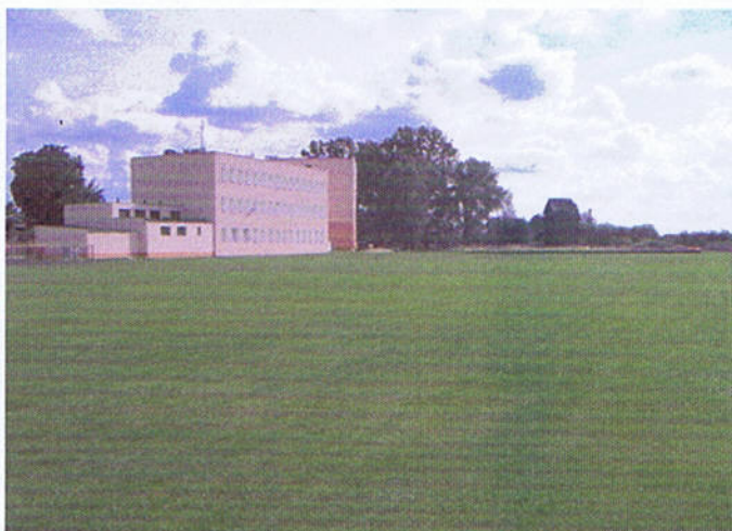
Boisko przy ZSP Czerniejewo