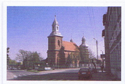
Kościół w Czerniejewie pw. Świętego Jana Chrzciciela

Innym ciekawym obiektem jest późnogotycki kościół pochodzący z pierwszej połowy XVI wieku, wielokrotnie jednak odbudowywany i przebudowywany zatracił swój jednolity, zabytkowy charakter. Przed kościołem znajduje się pomnik ks. Onufrego Kopczyńskiego – wybitnego filologa, określanego mianem „prawodawcy” gramatyki języka polskiego.