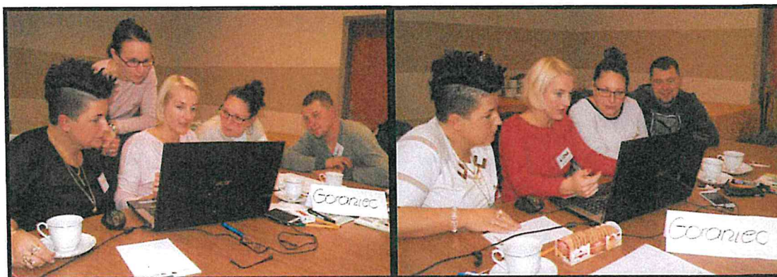
Grupa Odnowy Wsi w czasie warsztatów opracowania Sołeckiej Strategii Rozwoju. Świetlica wiejska w Pakszynie, dnia 04 - 05.XI.2016r.