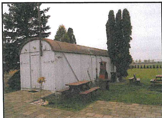
Świetlica wiejska „Ballada”