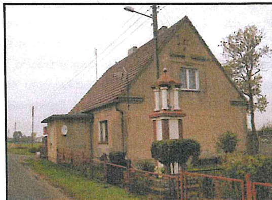
Prywatna posesja z miejscem kultu religijnego