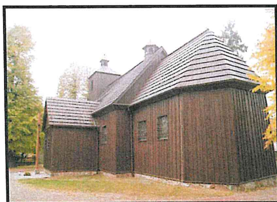
Zabytkowy drewniany kościół z 1762r.