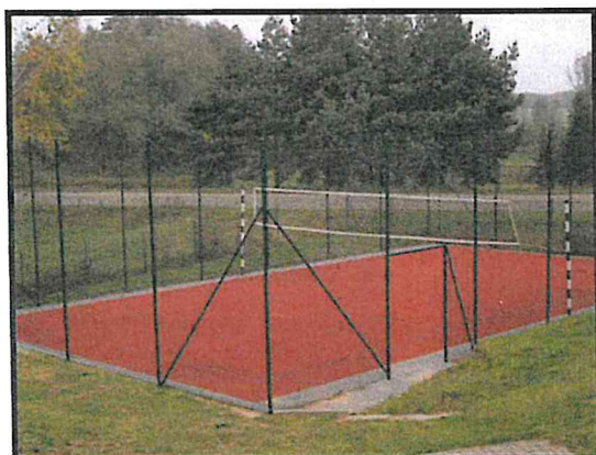
Miejsce sportu i rekreacji