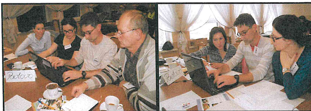
Grupa Odnowy Wsi w czasie warsztatów opracowania Sołeckiej Strategii Rozwoju. Świetlica wiejska w Pakszynie, dnia 04 - 05.XI.2016r.

SOŁECKA STRATEGIA ROZWOJU – PAWŁOWO wypracowana przez GOW na warsztatach w ramach programu UMWW - „Wielkopolska Odnowa Wsi 2013-2020”