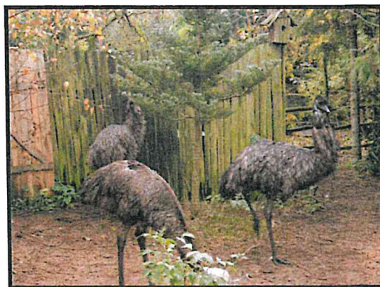
Gospodarstwo Agroturystyczne z Mini Zoo

SOŁECKA STRATEGIA ROZWOJU – PAWŁOWO wypracowana przez GOW na warsztatach w ramach programu UMWW - „Wielkopolska Odnowa Wsi 2013-2020”