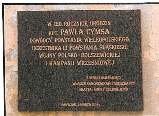
Pamiętkowa tablica kpt. Pawła Cymsa

SOLECKA STRATEGIA ROZWOJU - PAWŁOWO wypracowana przez GOW na warsztatach w ramach programu UMWW - „Wielkopolska Odnowa Wsi 2013-2020”