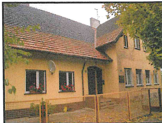
Budynek dawnej szkoły