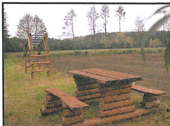
Ścieżka rekreacji i wypoczynku