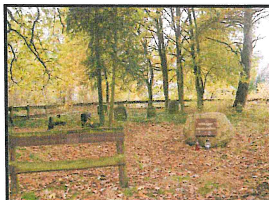
Zabytkowy cmentarz ewangelicko-augsburski

SOŁECKA STRATEGIA ROZWOJU - RAKOWO wypracowana przez GOW na warsztatach w ramach programu UMWW - „Wielkopolska Odnowa Wsi 2013-2020”