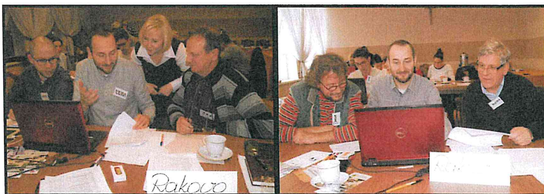
Grupa Odnowy Wsi w czasie warsztatów opracowania Sołeckiej Strategii Rozwoju. Świetlica wiejska w Pakszynie, dnia 04 - 05.XI.2016r.

SOŁECKA STRATEGIA ROZWOJU – RAKOWO wypracowana przez GOW na warsztatach w ramach programu UMWW - „Wielkopolska Odnowa Wsi 2013-2020”