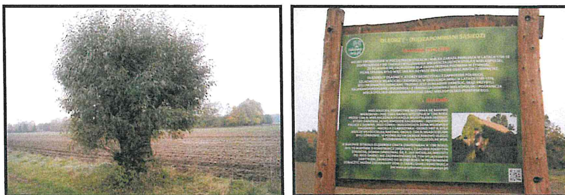
Żywa historia Oledrów na terenie sołectwa

SOŁECKA STRATEGIA ROZWOJU – RAKOWO wypracowana przez GOW na warsztatach w ramach programu UMWW - „Wielkopolska Odnowa Wsi 2013-2020”