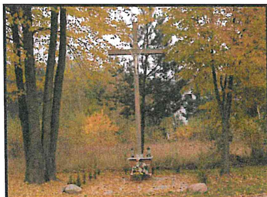
Miejsce kultu religijnego