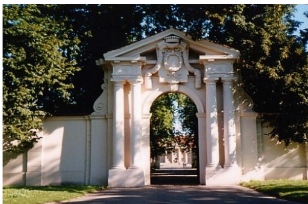
Rys. Brama wjazdowa