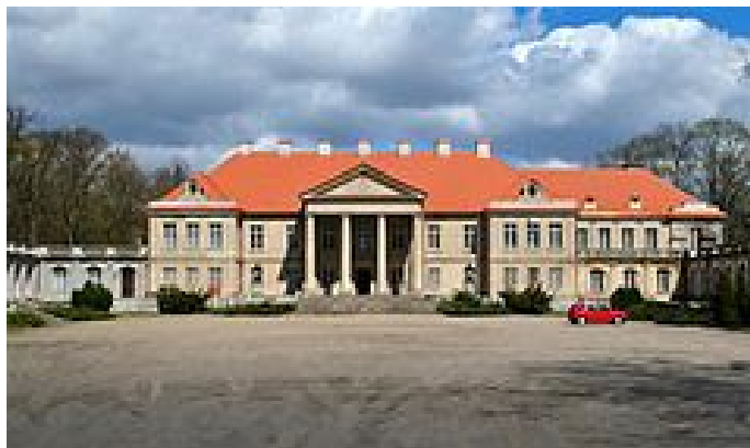
Rys. Pałac w Czerniejewie